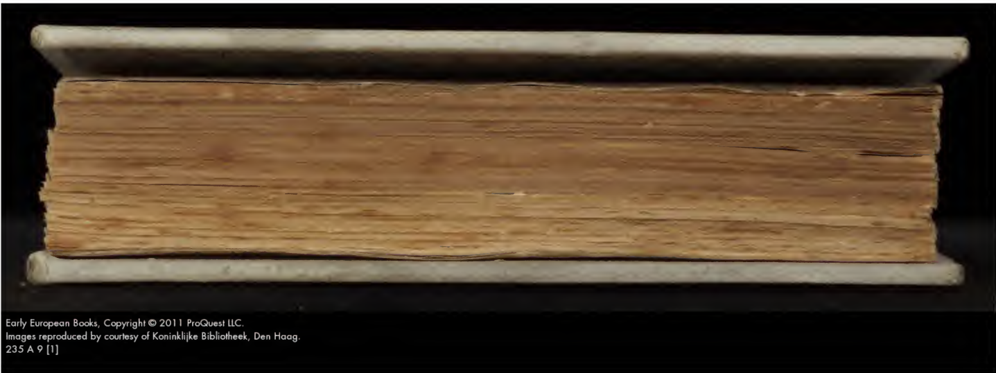
235 A 9 [1]